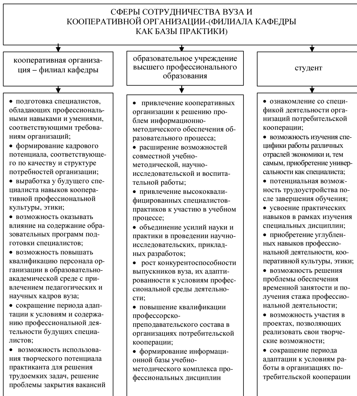
Рис. 1. Сферы сотрудничества вуза и кооперативной организации (филиала кафедры)

лючает договоры с кооперативными организациями на прохождение студентами производственной практики, открывает филиалы кафедр, в которых в соответствии с договором регламентировано определенное количество мест в расчете на каждый учебный год;