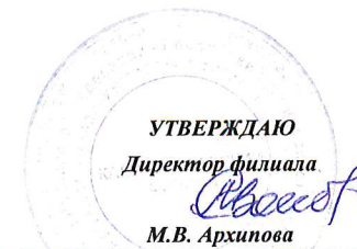
ГРАФИК УЧЕБНОГО ПРОЦЕССА Российского университета кооперации Калининградский филиал