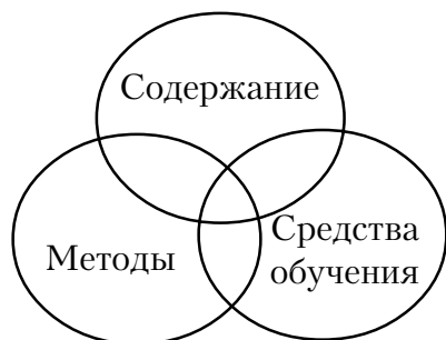
Схема 1. Взаимосвязь содержания, методов и средств обучения

Кроме лекций-презентаций в изучении дисциплины мультимедийное оборудование используется нами на практических занятиях