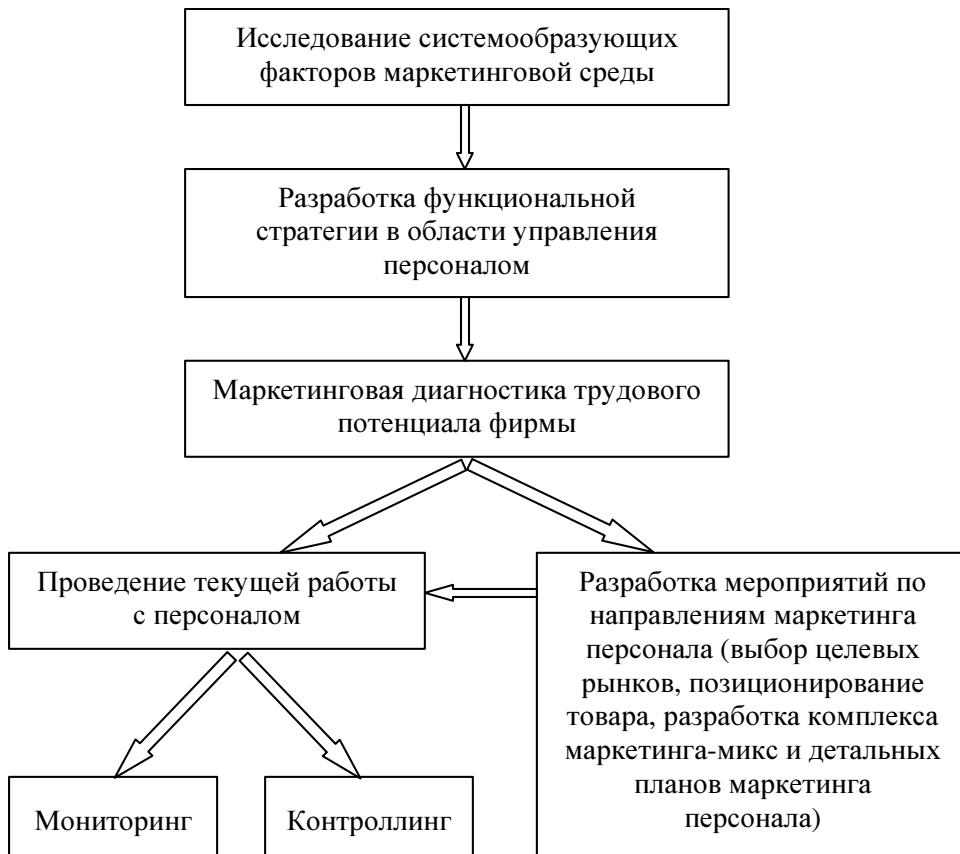
Рис. 1 Общая схема маркетинговой деятельности управления персоналом

Персонал должен соответствовать требованиям, которые предъявляются к нему должностными обязанностями, содержи-